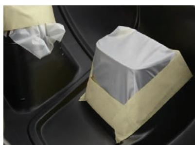
Łatwe i szczelne oklejanie nierównych powierzchni