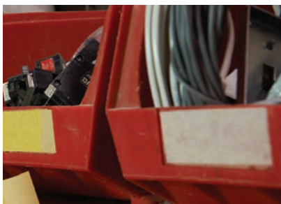
Możliwość przyklejania wszędzie tam gdzie chcesz