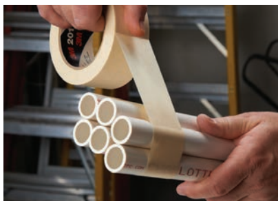
Szybkie i łatwe łączenie wiązek