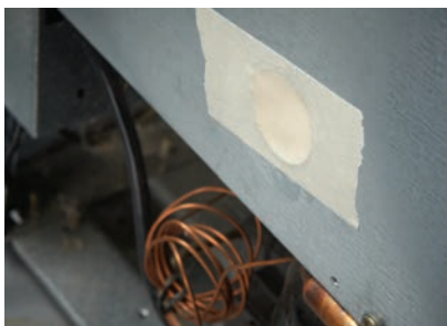
Uszczelnianie przy pianowaniu