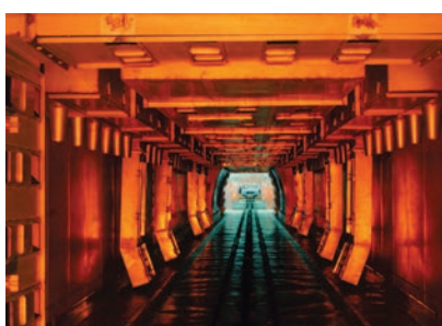
Temperatura suszenia aż do 160°C