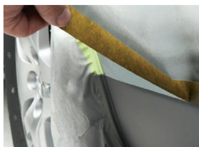
Nie pozostawia śladu